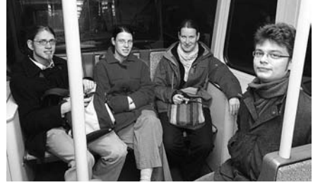
Fahrt zur Beatmesse

Bei einem Abend zum Thema russisch orthodoxe Kirche haben wir einen fiktiven Rundgang durch einen russisch orthodoxen Kirchbau unternommen, eine verbreitete Liturgieform – die Chrysostomosliturgie – kennengelernt und uns mit der Bedeutung von Ikonen beschäftigt.