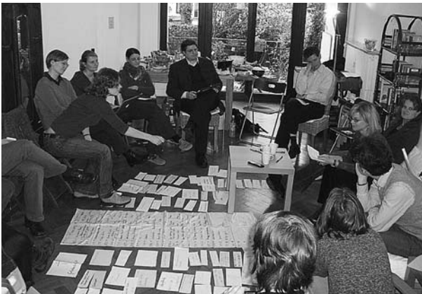
Programmplanung bei „mittendrin“