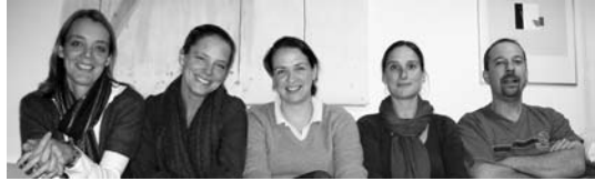
Der Vorstand 2009/2010

Kennen Sie noch den Förderverein der „Wittelsbacher Pänz“? Wozu gibt es so etwas überhaupt?