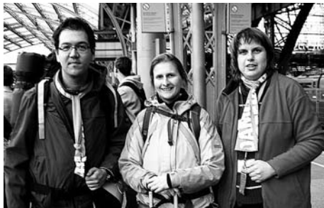
Rückreise vom ökumenischen Kirchentag

Nachdem einige „mittendrinler“ im März 2010 wie jedes Jahr an der Missionale in Köln, dem „Kleinen rheinischen Kirchentag“, teilgenommen hatten, war im Mai der Zweite ökumenische Kirchentag in München das Ziel. Das vielfältige Programm begeisterte trotz des regnerischen Wetters, und für jeden Teilnehmer war etwas dabei: der Eröffnungsgottesdienst auf der Theresienwiese und anschließend der Abend der Begegnung in der Münchner Innenstadt mit 300.000 Teilnehmern, eine orthodoxe Vesper, bei der an 1.000 Tischen Brot und Wein geteilt wurden, umjubelte Auftritte der zurückgetretenen Landesbischöfin Margot Käßmann, ein Konzert der Wise Guys mit 35.000 Fans, die lautstark gegen den Dauerregen ansangen, eine Nacht der Lichter mit Gesängen aus Taizé in den Messehallen oder ein Kleines ökumenisches Stundengebet, das von einem Mitglied von „mittendrin“ mitgestaltet wurde, und vieles mehr.