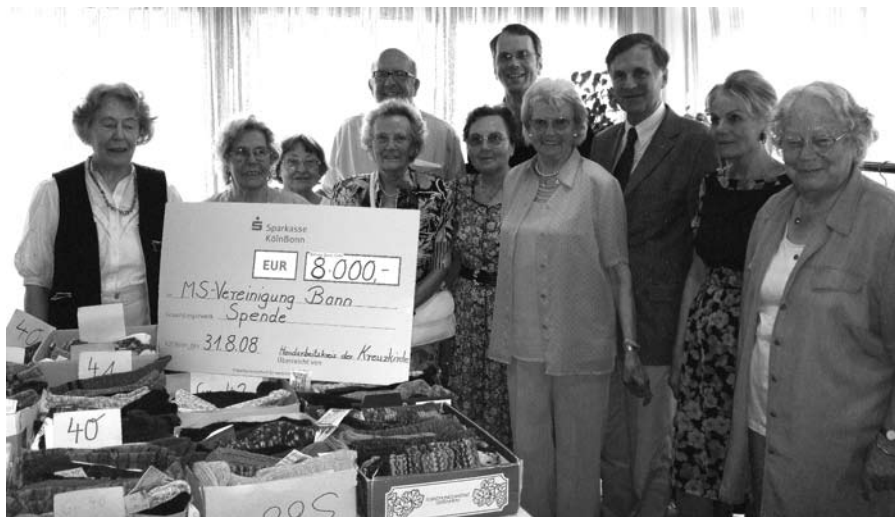
Der Handarbeitskreis der Kreuzkirche mit „Herrenbesuch“