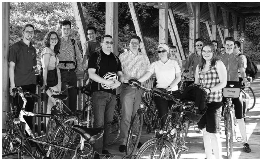
Radtour ins Ahrtal