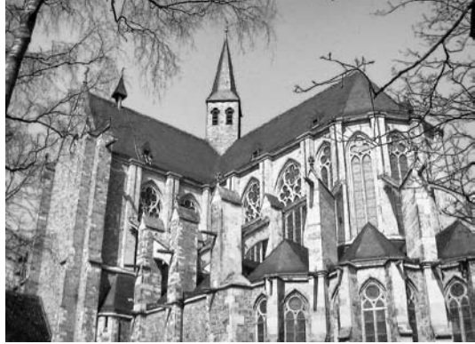
Simultankirche: Der Altenberger Dom