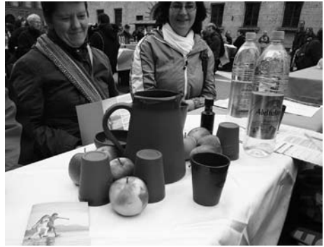
Ökumenische Vesper auf dem Odeonsplatz

So widersprach z.B. Wiens Kardinal Christoph Schönborn öffentlich dem Dekan des Kardinalskollegiums Angelo Sodano, der zu Beginn der Osterfeier-