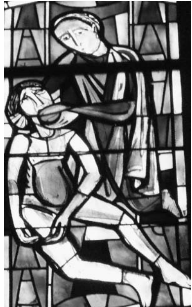
„Der barmherzige Samariter“ im rechten Altarfenster der Kreuzkirche

Da sind aber auch die Einladungen zu den Gemeindeguppen, zum gemeinsamen Teilen von Zeit, zu Erfahrungen, dass gemeinsam erlebte Zeit doppelt