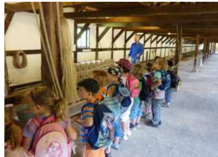
Kinder aus der Kindertagesstätte lernen im Freilichtmuseum Hagen die Seilherstellung kennen.