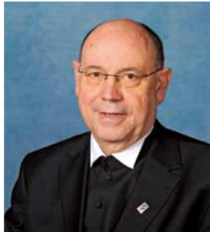
Präses Nikolaus Schneider, Vorsitzender des Rates der Evangelischen Kirche in Deutschland

Was für eine starke Hoffnung und ein großer Trost für gute und schlechte Tage: Das Evangelium vom Kreuz –