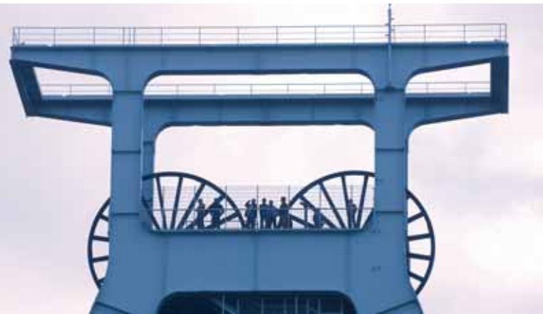
Deutsches Bergbaumuseum, Bochum