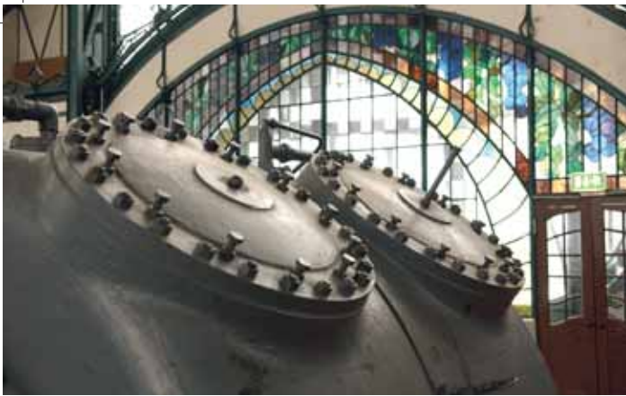
Zeche Zollern, Dortmund