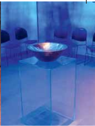
Christuskirche Bochum Marktkirche Essen