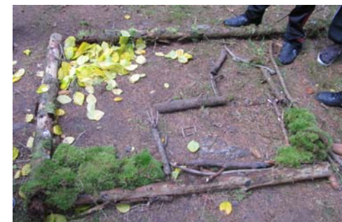
„Gemeinde“ — bildlich dargestellt

Für den neuen Katechumenenjahrgang, der 2012 konfirmiert werden soll, hat sich ein Team von acht Leuten aus der Gemeinde etwas Neues einfallen lassen (vgl. den Bericht zur Gemeindeversammlung).