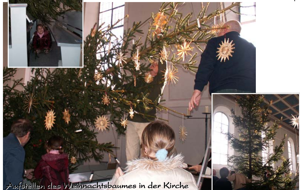
Aufstellen des Weihnachtsbaumes in der Kirche