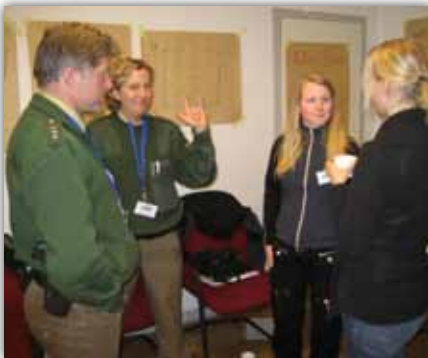
Begegnungswoche Gehörlose – Polizei 2007

Eine wichtige Erfahrung machen die Gehörlosen in einer Begegnungswoche von Gehörlosen und Polizei. Die Gehörlosenseelsorge im Bergischen Städtedreieck hatte zusammen mit der Polizeiseelsorge und der Fortbildungsstelle der Polizei in Wuppertal eine Fortbildung organisiert. 1 Woche lang hatten 10 Gehörlose und 10 Polizeibeamtinnen und –beamte Zeit, sich gegenseitig kennen zu lernen, von den besonderen Lebens- beziehungsweise Arbeitssituationen der Einzelnen zu erfahren und gemeinsam zu überlegen, wie Gehörlose und Polizeibeamte sich in Einsätzen möglichst stress- und konfliktfrei begegnen können.