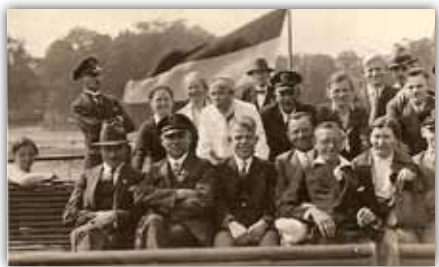
Ausflug nach Königswinter 1934

Diese Forderungen werden vom N.S. Regeede nicht angenommen. Daraufhin wird zwischen dem Verband und dem N.S. Regeede ein Vertrag geschlossen: der Verband ändert seinen Namen in „Rheinischer Verband evangelischer Taubstummengemeinden“; er beschränkt sich auf die rein seelsorgerliche Betreuung der Gemeindeglieder; der Verband verpflichtet sich, seinen Mitgliedern den Beitritt zum N.S.Regeede zu empfehlen; im Gegenzug verpflichtet sich der N.S. Regeede, seine Mitgliedern in Ausübung ihrer kirchlichen Pflichten zu fördern bzw. sie dazu anzuhalten.