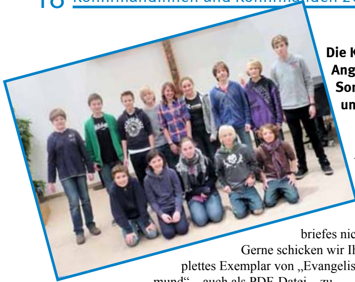
Die Konfirmation in Angermund findet am Sonntag, den 8.5.2011 um 10.00 Uhr statt.

Aus datenschutzrechtlichen Gründen werden die Namen der Konfirmanden in der Internet-Ausgabe unseres Gemeindebriefes nicht genannt.