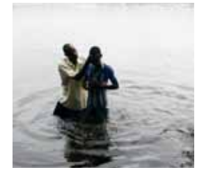
„Was war am Anfang mit Kirche einmal gemeint?“

Mittwoch, 30.3.2011: Glaube JA, Kirche NEIN