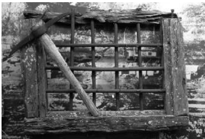
Original-Fenstergitter einer Lagerbaracke in Workuta

ser großen Lagerkomplexe war Workuta, nördlich des Polarkreises gelegen, im ewigen Eis. Dort musste mein Vater als politischer Häftling Kohle fördern, unter Bedingungen, die in gleicher Weise lebensfeindlich wie lebensverachtend waren. 1951 war er in der ehemaligen DDR verhaftet und von einem sowjetischen Militärtribunal zu 25 Jahren Zwangsarbeit in Workuta verurteilt worden. Ich wollte wissen, was war und heute noch ist. So bin ich meinem Vater nachgereist – im Zug – von Moskau nach Workuta. Von dieser Reise will ich erzählen, Bilder und Dokumente zeigen und vor allem über die beeindruckende Arbeit der Menschenrechtsorganisation MEMORIAL berichten, die sich der Aufarbeitung des Stalinismus mit Terror, Repressionen und Gulag widmet. (K.K.-M.)