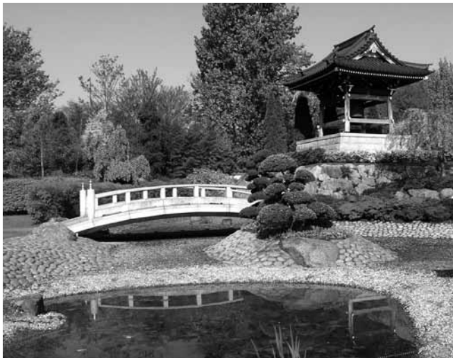
EKO-Tempel, Düsseldorf, Blick auf Glockenturm