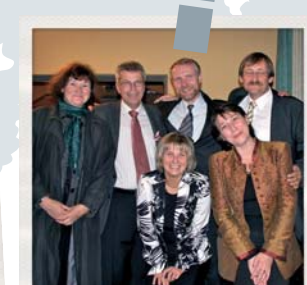
russische & deutsche Mitarbeiter

Ein Diakonieprojekt der Ev. Kirchengemeinde Wassenberg (NRW) in Zusammenarbeit mit Rurtal-Schule Oberbruch – Förderschule geistige Entwicklung