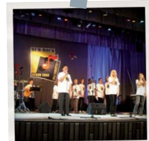
Konzert von "Wir zusammen"