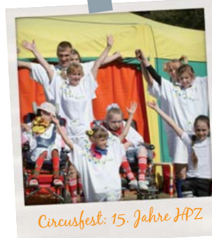
Circusfest: 15 Jahre HPZ