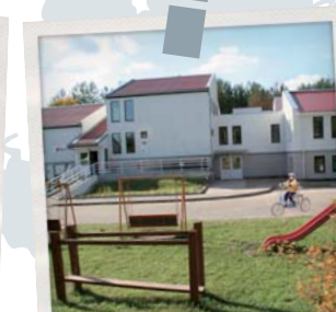
HPZ und Werkstufe