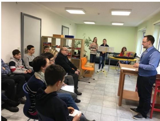
Abbildung 9: Einweihungsfeier

Am 14. März 2019 fand schließlich mit der Eröffnungsfeier der Projektabschluss statt. Wir erhielten eine musikalische Unterstützung durch einige Schulmusikerinnen und das Kuchenkomitee der Klassenstufe 11.