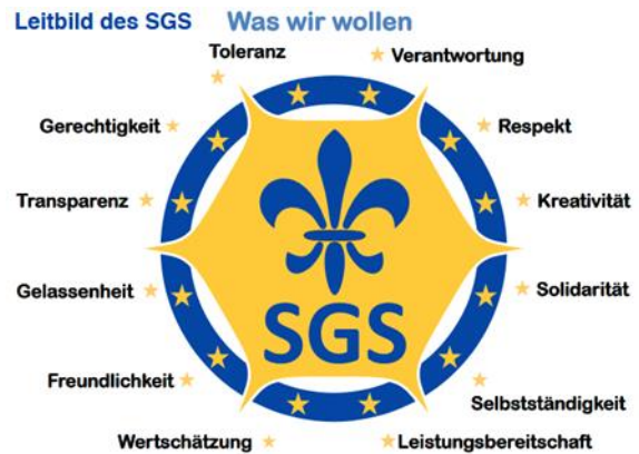
Abbildung 3: Schulleitbild des SGS

Unter Beachtung der Förderrichtlinien der Evangelischen Kirche im Rheinland und des Bistums Trier machte sich die Arbeitsgruppe an die Erstellung eines inhaltlichen Konzepts. Der Raum sollte der gesamten Schulgemeinschaft in all ihrer Pluralität zur Verfügung stehen, warm und gemütlich eingerichtet sein und einem Nutzungskonzept folgen, das Andachten, Stilleübungen, Morgenbesinnungen, Mediationen und seelsorgerliche Einzelgespräche umfasst. Die Regeln für die Nutzung des Raumes sollten sich dabei eng an den Werten orientieren, die in unser Schulleitbild eingeflossen sind: