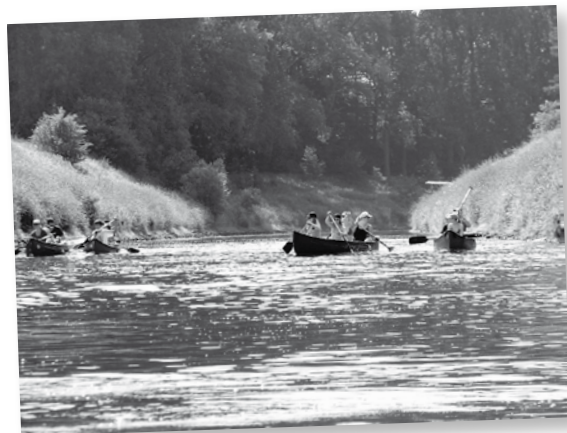
Es gibt keine Ideallinie!

Eine besondere Familienfreizeit war es schon, die zehnte eben. Und da uns beim Wechsel zwischen rustikalen Unterkünften in Burgen und modernen Jugendherbergen allmählich die Burgen in erreichbarer Nähe auszugehen drohten, hatten wir mal keine Jugendherberge gebucht, sondern ein Schulungshaus der Christlichen Arbeiterjugend CAJ – eine Premium-Herberge mit besonderem Niveau.