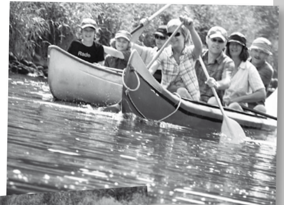
Volle Kraft voraus!

eine Wanderung, affenartig einen Kletterparcours durchhängeln, Radfahren, eine Zeche besichtigen usw., all inclusive. Der Rahmen für alle Aktivitäten war bisher immer eine tolle Gemeinschaft und eigentlich ist die das Wichtigste jeder Freizeit, egal, wohin die Reise geht.