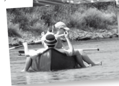
...oder treiben lassen

Den ganzen Bericht von der Freizeit lesen Sie auf unserer Homepage: www.rade-reformiert.de