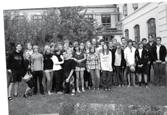
Das Team der „Älteren“