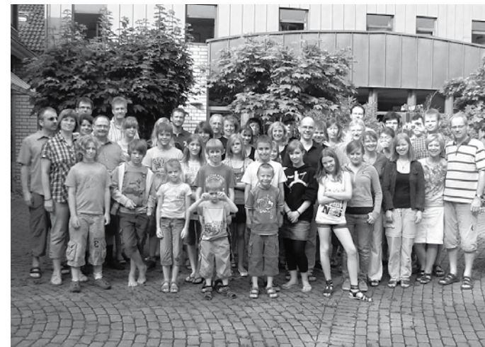
Obligatorisches Gruppenfoto vor dem CAJ-Haus