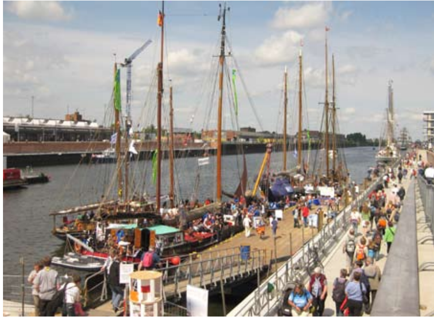
Ein Kirchentag der Schiffe - der Bremer Überseehafen