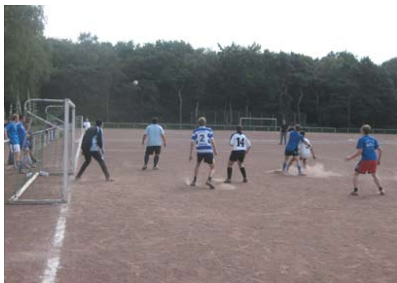
Spielszene: Gestaubt hat es ganz schön!

Die teilnehmenden Mannschaften hatten Spaß und lobten die gute Organisation des Turniers. Das Bezirk-4 Team bedankt sich bei allen Teilnehmern für faire Spiele und einen rundum gelungenen Tag.