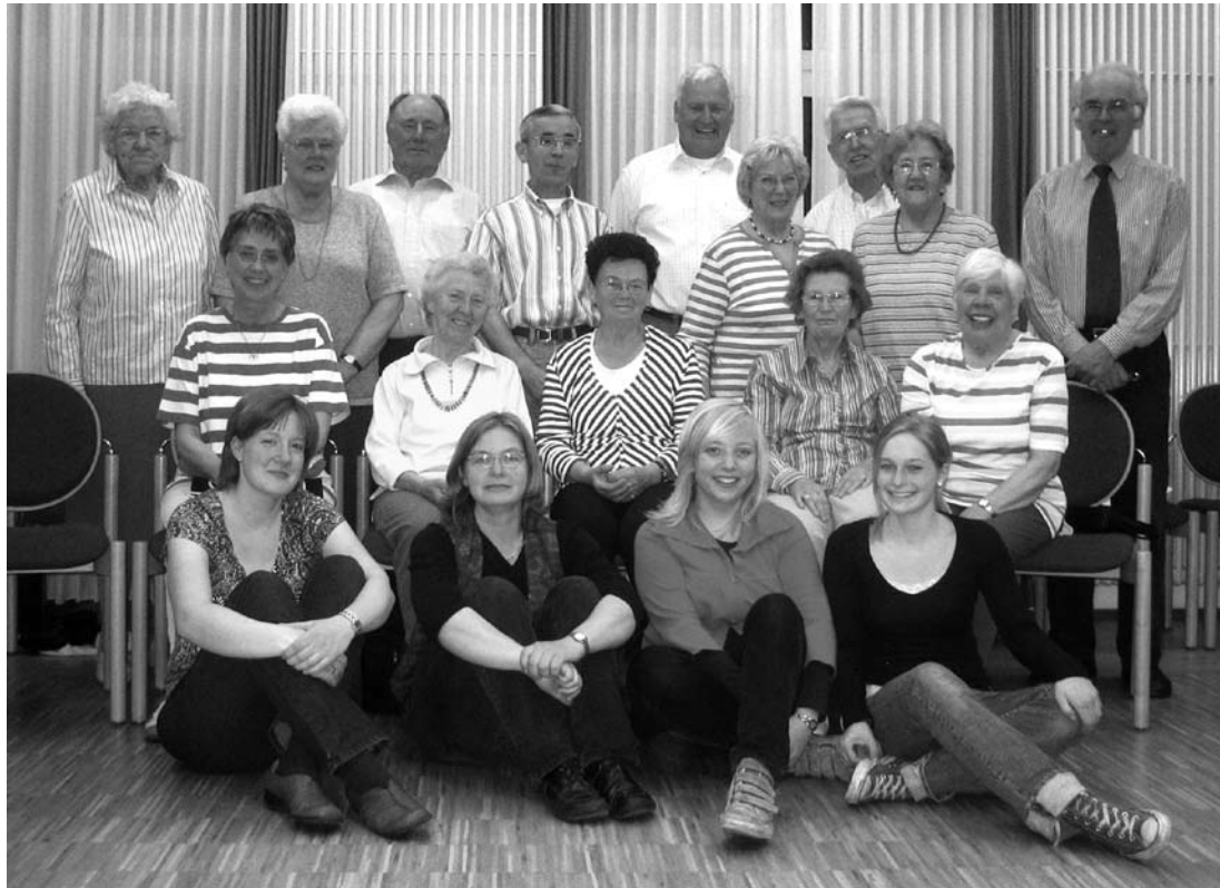
Der Chor der Gnadenkirche auf einer Aufnahme Juni 2009

Der Chor und auch das Presbyterium laden zu dieser musikalischen Geburtstagsfeier herzlich ein!