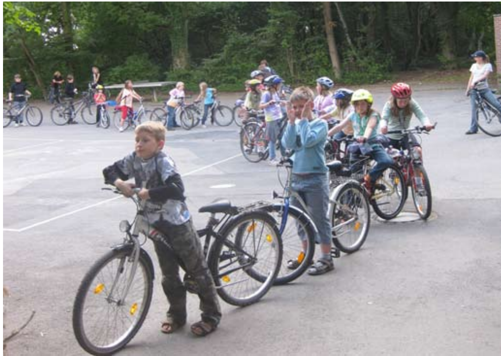
Startklar zur Fahrradtour