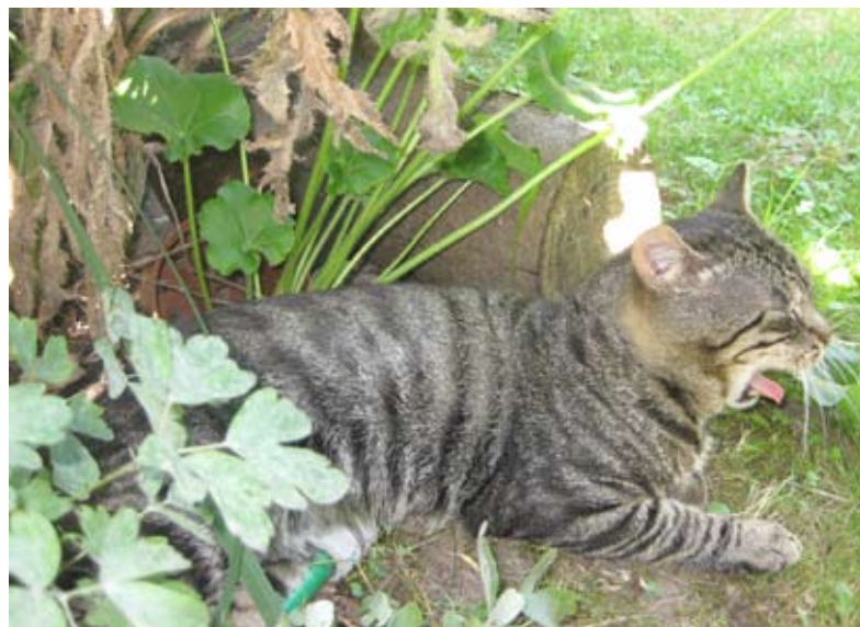
Nirgends hat man seine Ruhe!