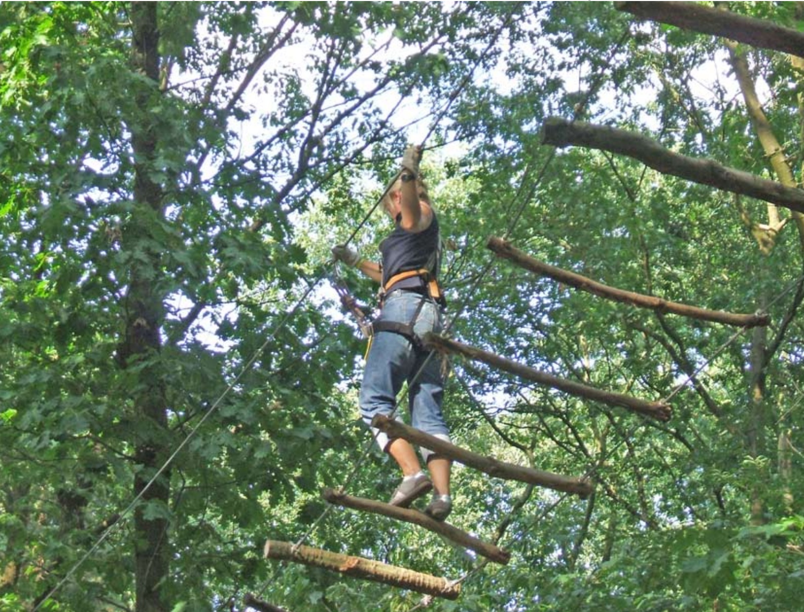
Bild aus dem Hochseilgarten tree2tree an der Wedau

Mitteilungsblatt der evangelischen Gemeinde Duisburg – Wanheimerort