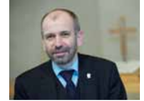
Manfred Rekowski Präses der Evangelischen Kirche im Rheinland